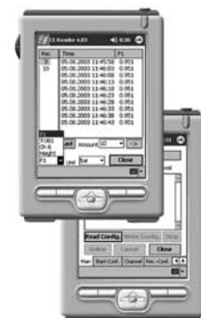
Logger 4.x also includes the WindowsCE- software for PDA's.