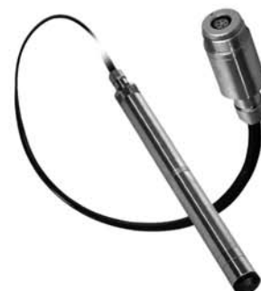
Version DCX-22 SG DCX-22 VG