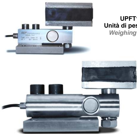
UPFT1 Unità di pesatura. Weighing unit.